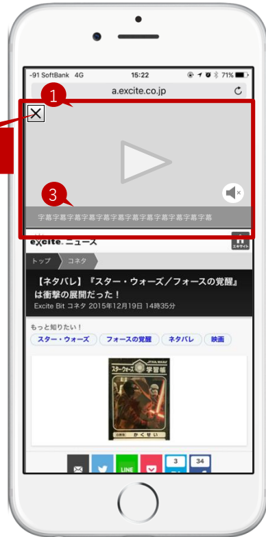
【エキサイトニュース】