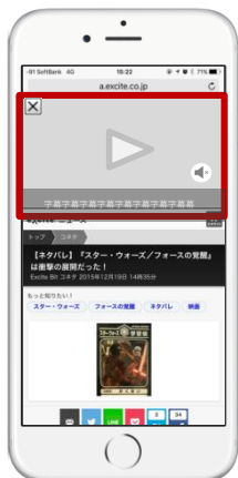
【ブランドムービー】