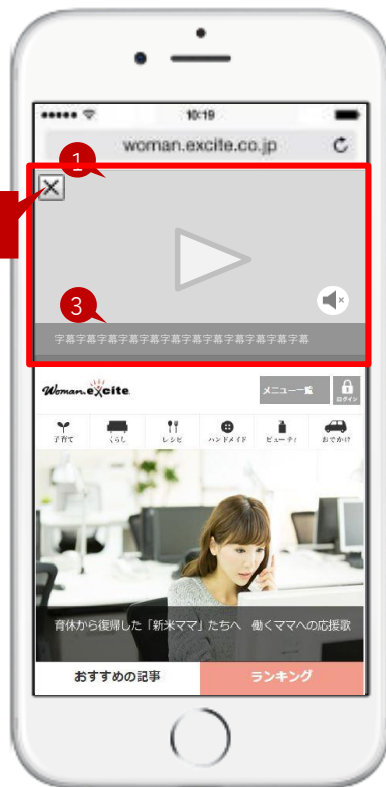
【ウーマンエキサイトTOP】