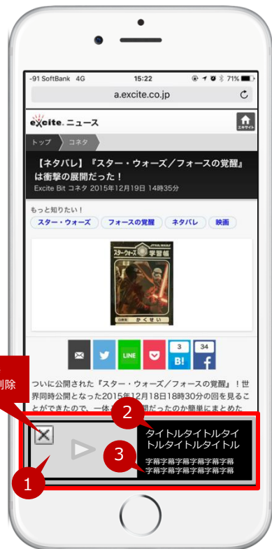
【エキサイトニュース】