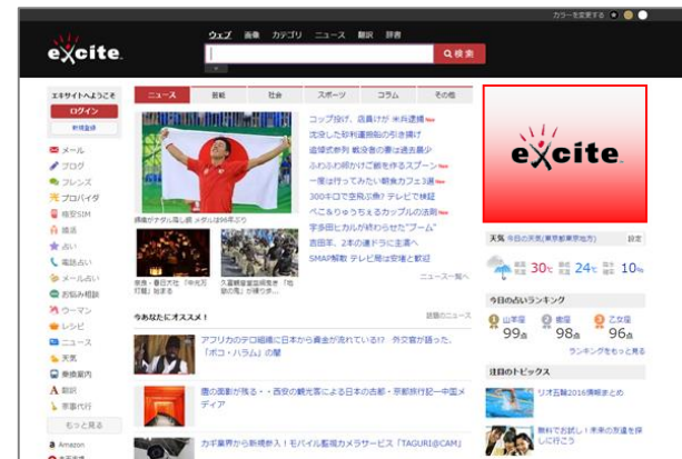
【エキサイト Top Page レクタングル】