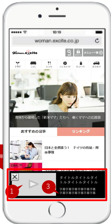
【ウーマンエキサイトトップ】