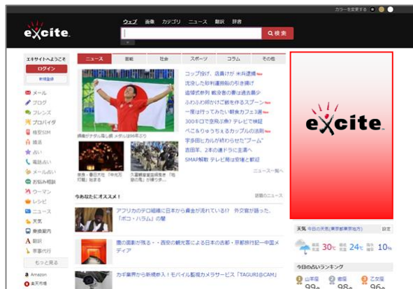
【エキサイト Top Page ビッグレクタングル】