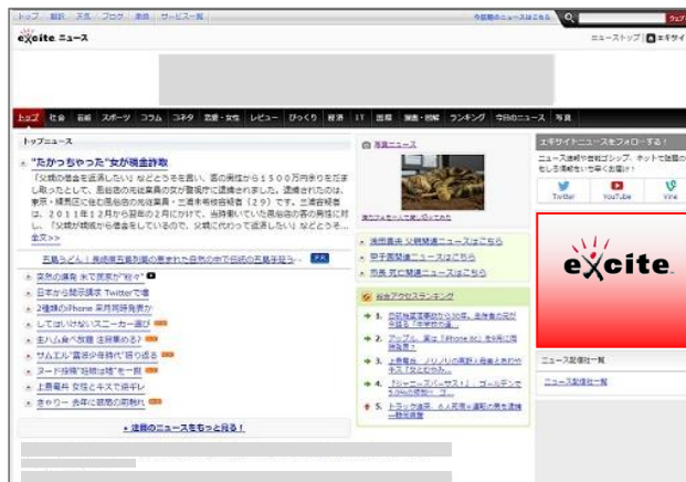
【エキサイト中面 レクタングル】